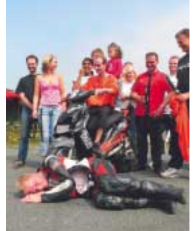
Proud to be loud! Scooter-Attack Stage6 feiert die Fast-Sensation.