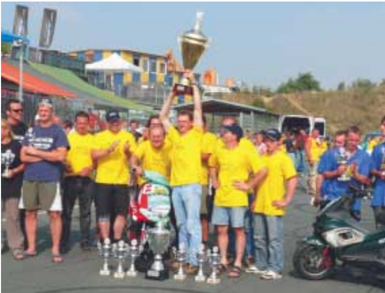
Strahlende und verdiente Sieger: das VCVD-Team mit dem Siegerpokal und dem Gilera Runner hatte eine perfekt eingestellte Mannschaft am Start.