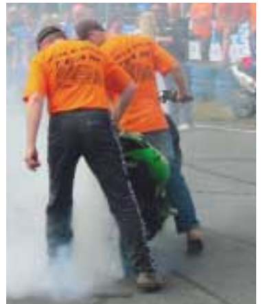
Die Kymcos von MSA drehen noch einmal richtig auf.