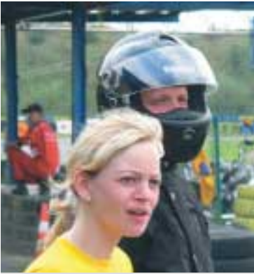
Anspannung pur: noch etwas über 18 Minuten bis zur Zielflagge.

oben. Erst in der letzten Rennphase verliert Aprilia den Kontakt zur Spitze, die Scooter machen ab jetzt das Rennen.