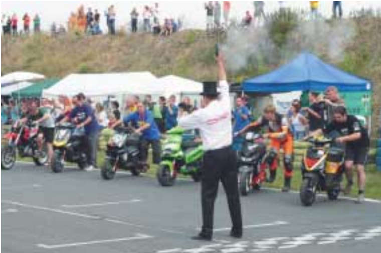
Ab jetzt heißt es: 24 Stunden Vollgas

es jetzt „Augen auf“. Effektiv und unauffällig arbeiten. Ebenso wie die Sportsicherung Sachsen e.V. Die einen sorgen für Ordnung außerhalb, die anderen für Sicherheit innerhalb des Parcours.