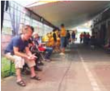
Die Ruhe vor dem Sturm in der Boxengasse.

Besucher strömen in den Harzring. Für das freundliche Team von R.S.D-Security heißt