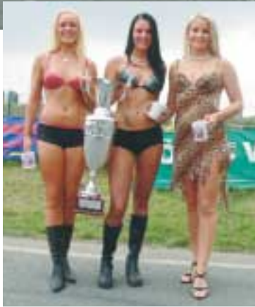
Das Objekt der Begierde.

Seit Donnerstag 18. August drehen die Piloten ihre Trainingsrunden. Die Maschinen werden auf die Piste eingestellt – die Fahrer können den