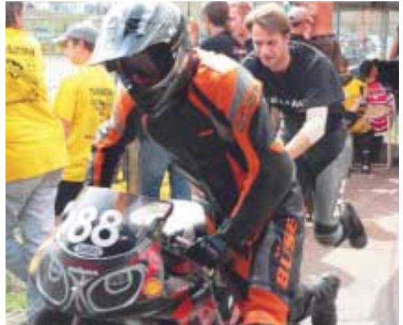
Tempo Tempo! Die Maschine auf dem Weg in die Box.