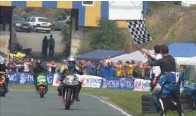
Endlich! Die Zielflagge erlöst die Piloten und Techniker von der Anspannung. Für die Rennleitung ist noch lange nicht Feierabend.

räusche. Das tiefe Brummen der Leichtkrafträder und der Roller der offenen Klasse. Etwas heller und energisch: die auf Platz drei liegende Aprilia. Und der durchdringende Bienenschwarm-Sound der kleineren Scooter – mal mit und mal ohne Auspufftopf. Dann die Zielflagge. Die Rennsicherung schwenkt gelb an allen Kontrollpunkten. Schluss mit Konzentration und Disziplin. Die Fahrer lassen Gummi auf