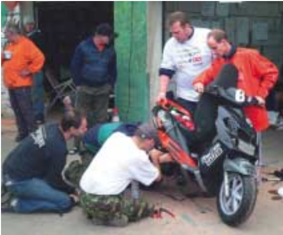
In der Box ist die Hektik größer, als auf der Piste