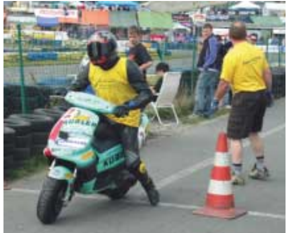
Am Ende der Boxengasse übernimmt der nächste Fahrer.