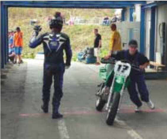
Motorstopp an der Einfahrt der Boxengasse.