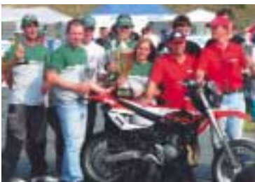
Der Gesamtsieger 2004 Aprilia muss sich diesmal mit dem Sieg in der eigenen Klasse begnügen.

sprochen. Vorjahres-Gesamtsieger Aprilia gewinnt in der Klasse LK5.